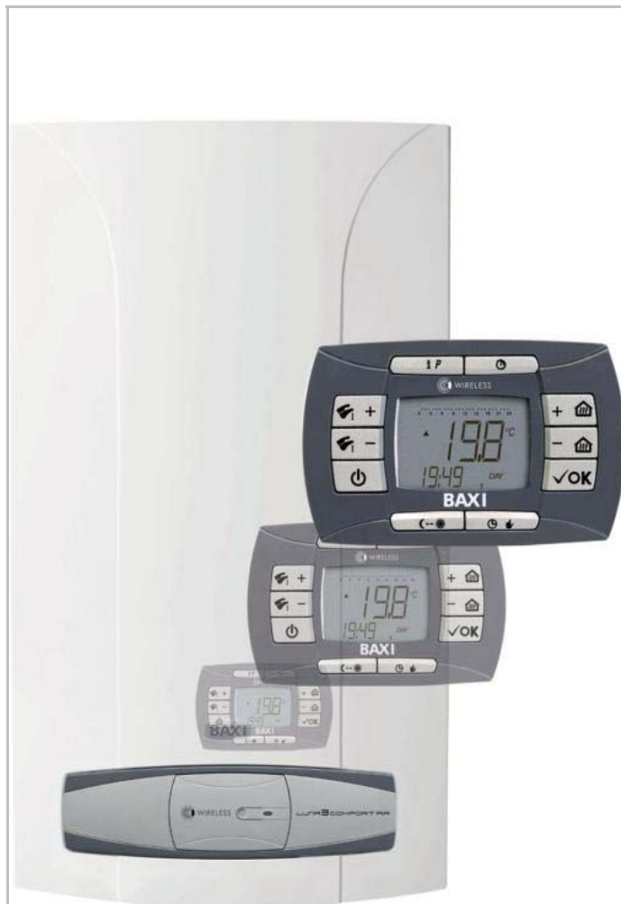
LUNA 3 COMFORT AIR