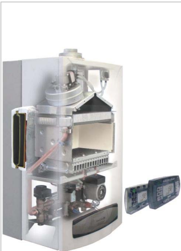
LUNA 3 COMFORT MAX